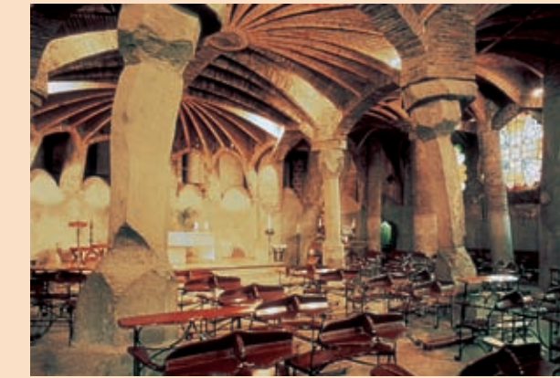
Interior de la cripta de la Colònia Güell (Santa Coloma de Cervelló)

El Baix Llobregat és un compendi de l'arquitectura modernista, des de les creacions més destacades fins a l'aplicació popular d'aquest estil. L'obra més emblemàtica és la cripta de la Colònia Güell, on Antoni Gaudí assajà moltes de les solucions que després aplicaria en altres projectes. L'art religiós i industrial es complementen amb la singular aportació que Jujol, deixeble de Gaudí, deixà en diversos habitatges de Sant Joan Despí, on desplegà tot un imaginari de gran plasticitat, i amb la visita a la fàbrica Pujol i Bausis d'Esplugues de Llobregat, productora de bona part de la ceràmica emprada pels arquitectes modernistes.