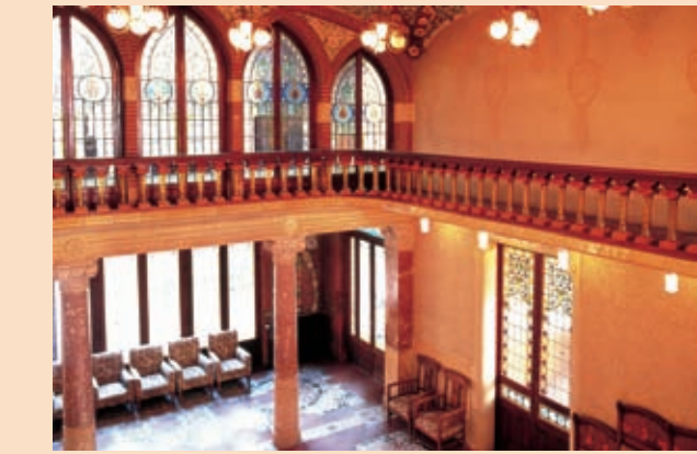
Institut Pere Mata

La Ruta del Modernisme és un agradable passeig pel centre de Reus, que permet conèixer algunes de les façanes modernistes més interessants i reviure l'esperit de 1900. Tot i ser el lloc d'origen i formació d'Antoni Gaudí, la ciutat no compta amb cap edifici original de l'artista però sí un magnífic centre d'interpretació sobre la seva vida i la seva obra, el Gaudí Centre. D'altra banda, la ruta presenta edificis tan notables com l'Institut Pere Mata, la Casa Rull, la Casa Gasull o la Casa Navàs, de Lluís Domènech i Montaner, l'arquitecte que va deixar l'empremta més forta del Modernisme a Reus.