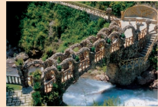
Jardins Artigas (la Pobla de Lillet)

A la vall de Lillet, i seguint un estret meandre del riu Llobregat, prop del seu naixement al Pirineu, el genial artista Antoni Gaudí va concebre l'únic jardí humit dels que arribaria a projectar. L'espai compta amb innumbrables elements, plens de fantasia i imaginació, com ara ponts, grutes, glorietses, animals o fonts, tots ells perfectament integrats en l'esplèndida natura que els acull. L'itinerari es complementa amb la visita a l'espectacular fàbrica de ciment del Clot del Moro, un altre exemple modernista d'integració amb la natura, en aquest cas, un edifici industrial, obra de Rafael Guastavino, avui museu.