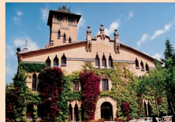
Can Millet de Baix (l'Ametlla del Vallès)

A diverses poblacions del Vallès Oriental, com ara la Garriga, Cardedeu o l'Ametlla del Vallès, les famílies burgeses de finals del segle XIX van establir-hi les seves segones residències per tal de passar els estius en contacte amb la natura i prop de les aigües termals de la zona.