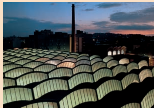
Vapor Aymerich, Amat i Jover

A Terrassa, una de les ciutats catalanes i espanyoles més representatives de l'avantguarda de la revolució industrial, el modernisme s'expressà no tan sols mitjançant la construcció de luxosos habitatges per a les famílies burgeses sinó també en edificis industrials i de serveis: fàbriques, magatzems, botigues o edificis públics.