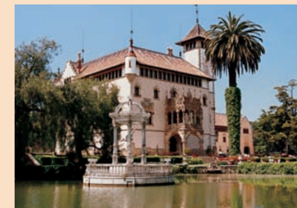
Can Garí (Argentona)

Al llarg d'aquesta costa propera, al nord de Barcelona, i especialment a les poblacions de Canet de Mar, Mataró i Argentona, es troben alguns dels edificis modernistes més notables creats pel geni de diversos arquitectes, especialment per dos dels grans noms del modernisme català: Lluís Domènech i Montaner i Josep Puig i Cadafalch.