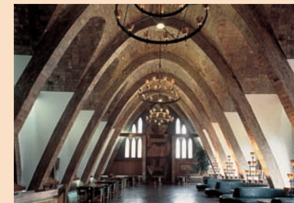
Interior de les Caves Codorniu (Sant Sadurn d'Anoia)

Enmig de poblacions i vinyes, el visitant troba en el seu trajecte elements arquitectònics molt interessants, que mostren que l'impacte del modernisme no tan sols es produí en les ciutats sinó que també s'arrelà, de manera notable, en l'entorn rural.