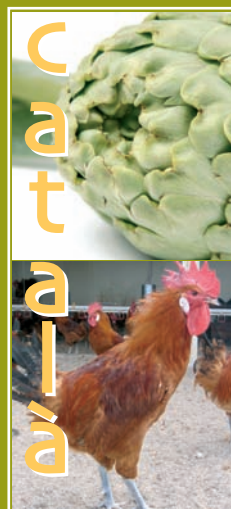
Carxofa Prat (IGP en tràmit)