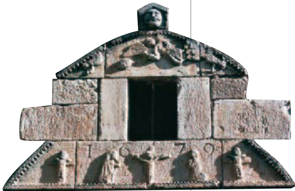
Finestra de Rajadell / Fenêtre de Rajadell

↕ El patrimoni arquitectònic que trobem en diversos municipis del Cardener és el millor reflex per apropar-nos a una època plena de canvis socials i econòmics. El romànic és l'estil amb més implantació i en trobem les edificacions més significatives a les esglésies de Sant Vicenç de Cardona —obra mestra del segle XI—, Sant Julià de Coaner i Sant Cugat de Racó. Fer un recorregut pel romànic del Cardener esdevindrà una manera de conèixer el territori, el paisatge i la seva gent.