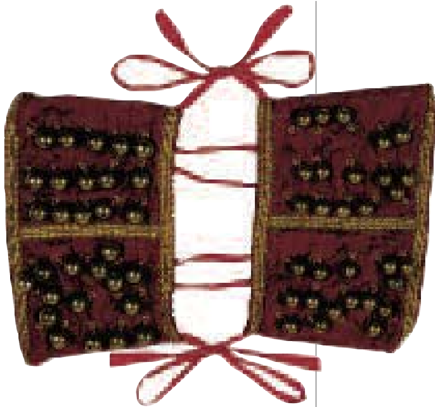
Peça del vestit tradicional / Élément d'un costume traditionnel

Les manifestacions folklòriques tradicionnelles sont encore nombreuses dans tous les villages du El Cardener, quelle que soit leur taille. Les « caramelles », gardent leur splendeur dans la plupart des communes : des chants et des danses pour fêter Pâques, parmi lesquelles la Danse du Grelot est spécialement représentative. La touche singulière c'est Callús et Súria qui l'apportent : avec de longues tiges en bois, dépliées à la verticale, les chefs de « colla » (groupe folklorique), offrent une fleur en guise de remerciement aux balcons des maisons du village, occupés par les habitants et leurs invités. Dans certains villages comme Rajadell, les « bastoners » font preuve de grande habileté pour construire des danses pleines de beauté à partir de coups de bâton bien synchronisés. Les « cercavila » sont habituels dans toutes les grandes fêtes, avec leur groupe de « trabucaires » qui annoncent le commencement des célébrations à coup de salves assourdissantes. L'une des manifestations les plus réussies des dernières décennies (née en 1977) est la crèche vivante du El Bages, située aux « Torres de Fals », un site à saveur historique en pleine nature. À Santpedor, une crèche vivante plus jeune consolide sa réputation dans un centre-ville ancien bien soigné.