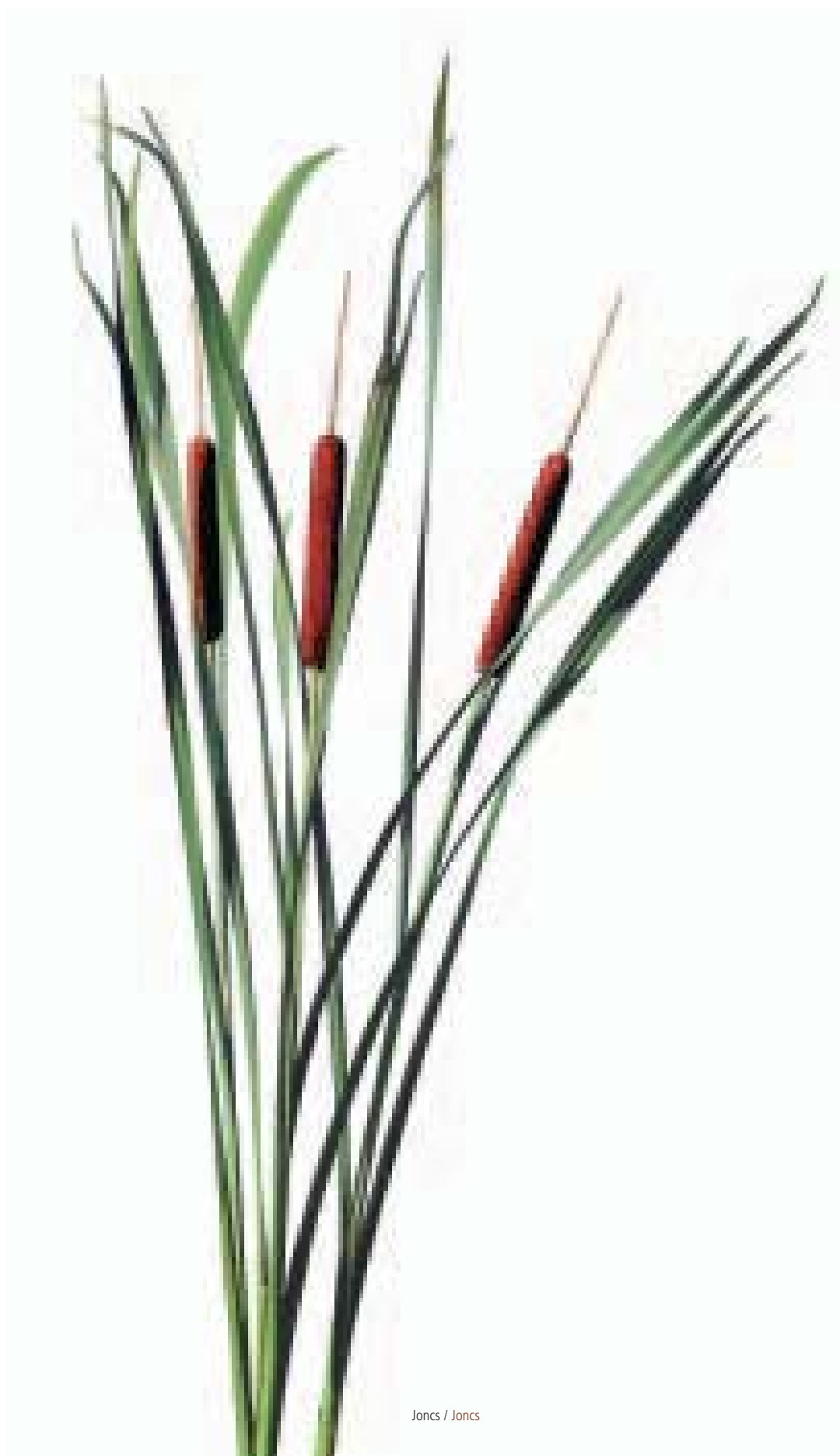
Juncus / Juncus